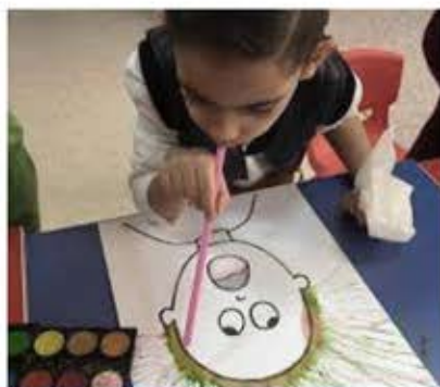
Pintar soplando pintura

A los niños les encanta soplar y al mismo tiempo estimulas su lenguaje