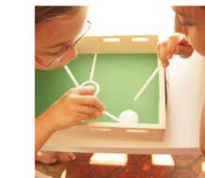
Jugar fútbol con popote