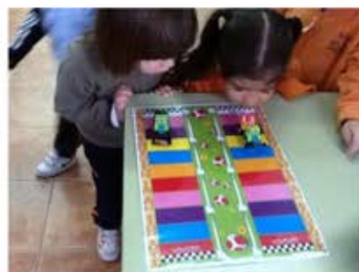
Carrera de carritos